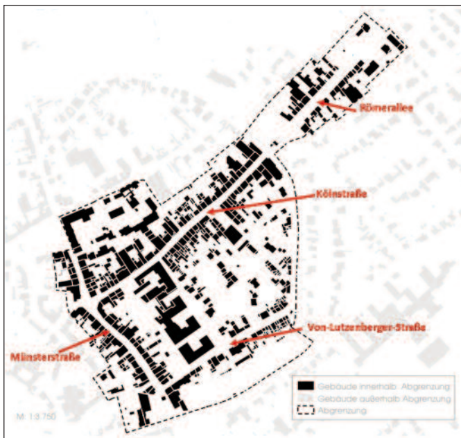
Abgrenzung des Untersuchungsraums (südöstlicher Stadtkern)

Wichtig: Alle aufgrund des Corona-Erlasses notwendigen Vorsichtsmaßnahmen (z. B. Abstandsgebot) werden bei der Veranstaltung eingehalten. Sollte die Veranstaltung bedingt durch die Coronakrise nicht durchgeführt werden können, werden wir Sie hierzu direkt über die städtische Internetseite www.stadt-zuelpich.de und über die einschlägigen Medien informieren.