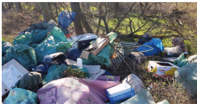
Eine große Menge an Müll haben Umweltafrevler am Marienholz bei Weiler in der Ebene illegal entsorgt.

Zeugen, die sachdienliche Hinweise geben können und/oder vor dem 23. März verdächtige Beobachtungen im Bereich Marienholz gemacht haben, werden gebeten, sich beim Ordnungsamt der Stadt Zülpich (Tel. 02252-52324; Mail: wlorse@stadt-zuelpich.de ) oder beim örtlichen Polizeibezirksdienst (Tel. 02252-950169) zu melden.