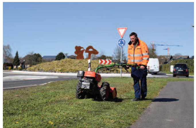
Die Flächen für die Blühstreifen – hier an der Bonner Straße im Bereich des Wohngebietes „Seegärten“ – wurden vom Baubetriebshof der Stadt Zülpich mit einer Fräse für die Aussaat vorbereitet.

Von den Mitarbeitern des Baubetriebshofes der Stadt Zülpich wurden die entsprechenden Flächen kürzlich mit einer Fräse für die Aussaat vorbereitet. Sobald es die Witterung zulässt, soll das Saatgut dann ausgebracht werden. Versuchsweise werden verschiedene Mischungen eingesät. Diese stammen von der Firma Rieger-Hoffmann aus Blaufelden und sind auf die fetten Böden der Zülpicher Börde abgestimmt. Bei der Realisierung des Projektes kooperiert die Stadt Zülpich außerdem mit der Firma J&M Strick aus dem Zülpicher Industriegebiet, die dafür eine akkubetriebene Walze zur Verfügung stellt.