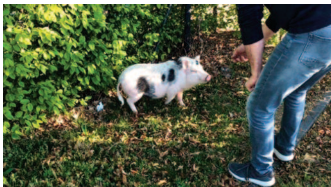
Entlaufenes Hausschwein am Wassersportsee Zülpich; © Stadt Zülpich / Julia Schneider

Laut Angaben des Tierheims Mechernich handelt es sich um ein weibliches Hausschwein, das nun mindestens zwei Wochen lang von Pflegern versorgt wird. Der Besitzer kann sich beim Tierheim melden. Meldet sich in dieser Zeit niemand, kann das Tier an Privatpersonen vermittelt werden.